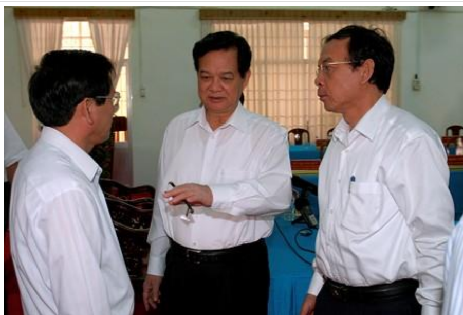
Thủ tướng Nguyễn Tấn Dũng trao đổi với lãnh đạo tỉnh Trà Vinh.