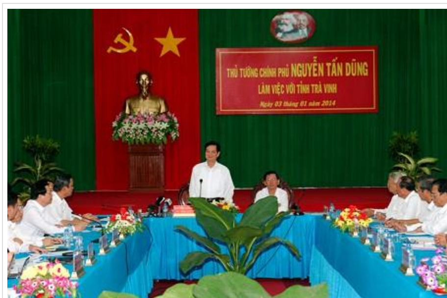
Thủ tướng Nguyễn Tấn Dũng làm việc với lãnh đạo tỉnh Trà Vinh.

(Chinhphu.vn) – Sáng nay (3/1), Thủ tướng Nguyễn Tấn Dũng cùng đoàn công tác của Chính phủ có buổi làm việc với lãnh đạo tỉnh Trà Vinh về tình hình kinh tế-xã hội của địa phương.