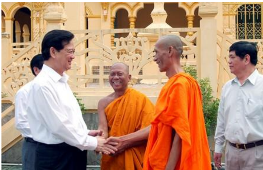
Thủ tướng Nguyễn Tấn Dũng và các vị chức sắc tôn giáo của Hội đồng Trị sự Giáo hội Phật giáo tỉnh Trà Vinh tại chùa Angarrã Japurĩ.

Cũng trong sáng 3/1, Thủ tướng Nguyễn Tấn Dũng đã tới thăm, tặng quà, chúc mừng năm mới các vị chức sắc tôn giáo của Hội đồng Trị sự Giáo hội Phật giáo tỉnh Trà Vinh tại chùa Angarrã Japurĩ (chùa Âng).