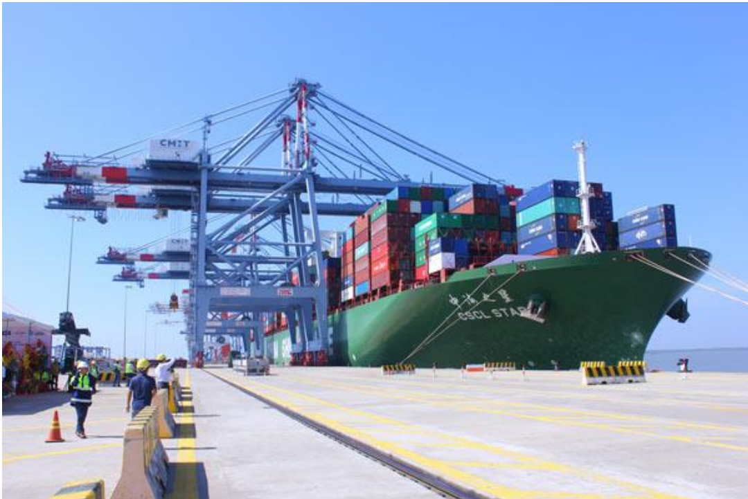
Tàu container CSCL Star có trọng tải 160.000 tấn với sức chở 14.000TEU cập thành công bến cảng Quốc tế Cái Mép (CMIT).

(SGGPO).- Ngày 29-10-2015, trước sự chứng kiến của đại diện Chính phủ Đan Mạch và Bộ Giao thông Vận tải Việt Nam, tàu container CSCL Star có trọng tải 160.000 tấn với sức chở 14.000TEU đã cập thành công bến cảng Quốc tế Cái Mép (CMIT) của khu cảng quốc tế Cái Mép - Thị Vải nằm trên địa phận tỉnh Bà Rịa - Vũng Tàu.